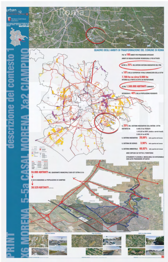
DESCRIZIONE DEL CONTESTO